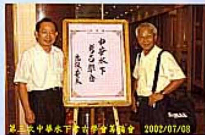
第三次中華水下考古學會籌備會 2002/07/08

園”的一筆基金，以“保護自然生態並資源應用”為由，撥給“中華潛水公司”來主持一項為期六年的保育計劃。